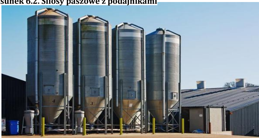
Rysunek 6.2. Silosy paszowe z podajnikami