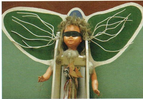
Wykonana przez Władysława Hasióra trójwymiarowa odmiana kolażu.

Z czasem instalacje przekształciły się w „sztandary”, m.in. Sztandar Ekstazy , miękkie płachty przypominające chorągwie używane podczas kościelnych uroczystości. Hasiór sam organizował procesje – odświętnie ubrani górale albo strażacy wędrowali z nimi po podhalańskich łąkach.