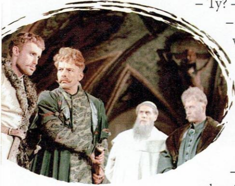
Kadr z filmu Potop w reż. Jerzego Hoffmana

– Na stu jeden chyba powróci z takiej imprezy – odrzekł pan Piotr. [...]