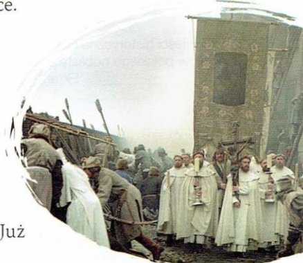
Kadr z filmu Potop w reż. Jerzego Hoffmana

[8.] Jednocześnie odgłosy zamieszania poczęły dolatywać i ze szwedzkiego obozu. Na wszystkich szanicach zabłysły ognie.